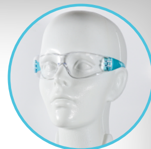
Modo de uso.