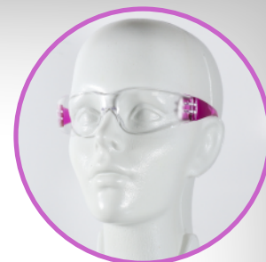
Modo de uso.